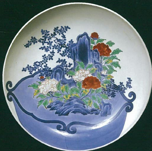
鍋島色絵岩牡丹植木鉢文大皿(重要文化財)